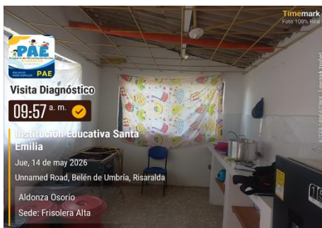
Fotografía 1: Área de preparación y consumo