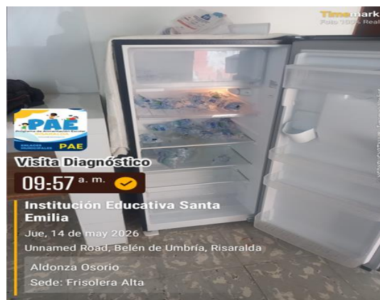
Fotografía 4: Menaje existente

Nota: Se observa que se cuenta con buenas condiciones en el área de preparación y almacenamiento de los alimentos, buenas condiciones del piso y de sus alrededores.