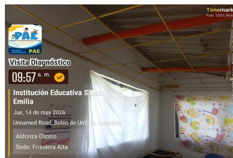
Fotografía 2: No cuenta con cielorraso